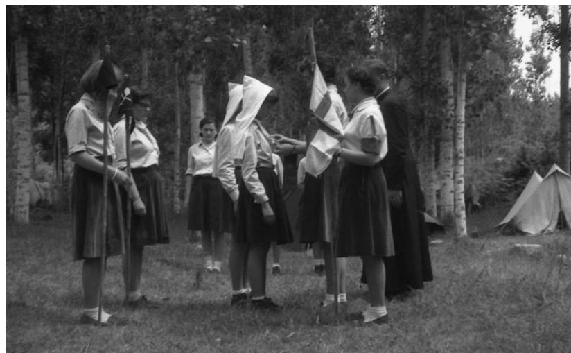
Noies guies de l'Agrupament Guia Germana Maria Teresa.

Ànim que no sigui la primera i última participació. De vosaltres depèn. Ànim!☑