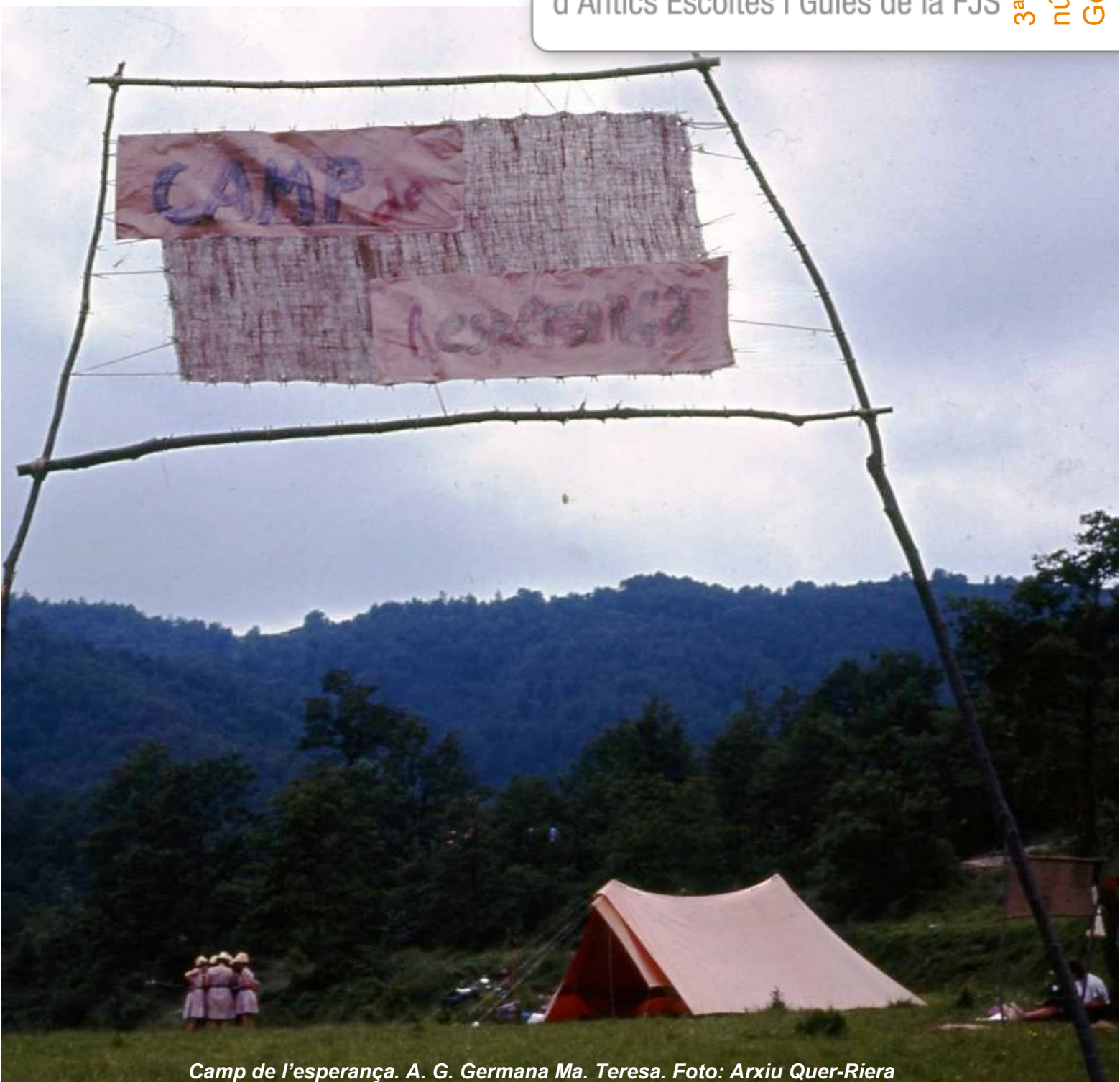
Camp de l'esperança. A. G. Germana Ma. Teresa.