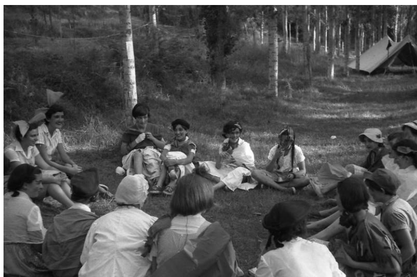
Preparant una actuació.