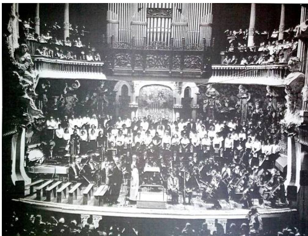
El Concert de la Solidaritat al Palau de la Música (13 de maig de 1988).

Pertorbada l'harmonia universal pel pecat, el diví Orfeu, Jesucrist Senyor nostre, vingué al món per a restaurar-la amb la restauració dels sentiments humans, donant Ella la regla i mida del deure, la pauta de l'harmonia de la vida, que consisteix en el compliment de les obligacions que deriven de la naturalesa humana i de la situació que cadascú té en aquest món».☑