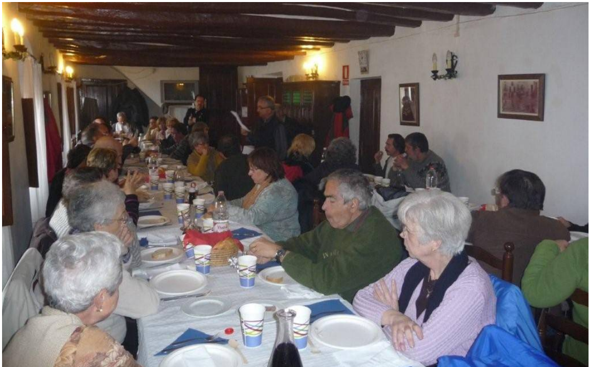
La "Descoberta de primavera" de 2011 va acabar amb calçotada al costat de l'ermita de la Mare de Déu de la Roca (Baix Camp).