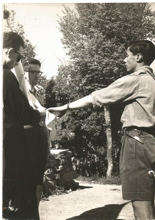
La Promesa escolta era símbol del compromís personal

En la tasca de cap d'aquells anys vaig experimentar les estratègies del mètode. En el sistema de patrulles cadascú era responsable del seu progrés personal, mentre es fomentava la dinàmica de que el gran podia ajudar al petit.