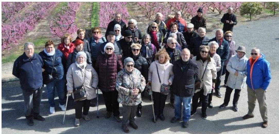
Record de la darrera activitat realitzada.

PD. Com que aquest editorial s'ha preparat el dia 8 de març i per tal de no ser farragosos, podeu posar als termes que siguin masculins els corresponents femenins