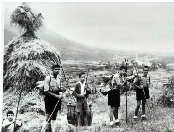
Tornant del camp d'estiu 1957. Al fons, St. Romà de Sau abans del pantà

Érem a mitjans de la dècada dels cinquanta del segle passat, quan un grupet de minyons ens reuníem els diumenges al matí a la biblioteca del Casal Claret, perquè per no tenir, no teníem ni cau on reunir-nos. La nostra formació començava en aquestes reunions, en el joc pel Casal i la ciutat i, en les sortides a la natura.