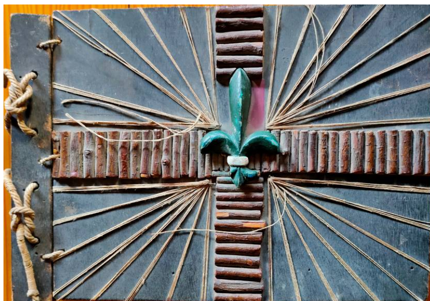
Aquesta obra d’art és la coberta de l’àlbum d’on han sortit les fotos que il·lustren l’article sobre els inicis de l’A. E. Pare Claret.