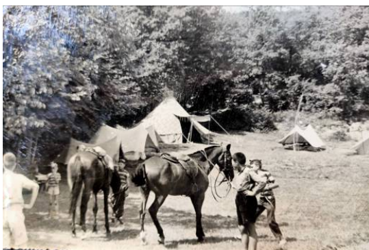
Després de la primera tenda en van venir d'altres. Campament a Cantonigròs, 1958