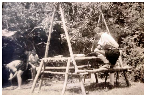
"Menjador" de la patrulla Esquirols

L'activitat principal va ser un concurs de salses de tomàquet fregit per patrulles. Tots havíem de dur un tomàquet de casa, i cada patrulla una paella, oli i sal. Mentre uns recollíem llenya del bosc, els altres ratllaven el tomàquet. La patrulla "esquirols" va guanyar el concurs perquè la cocció va ser perfecte i el punt de sal també. Ara imagineu quins temps, que una colla de nens poguéssim fer foc a Collserola.