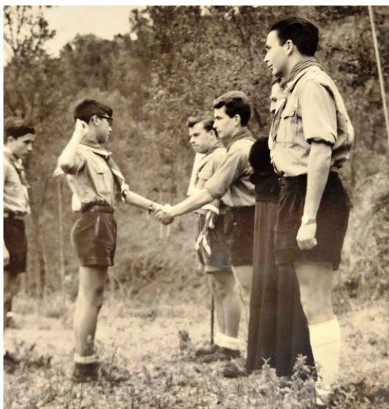
Una de les primeres promeses

Tot i tenir un nombre molt important de minyons de parla catalana a casa, la pressió social del moment, el barri, l'escola, l'església, l'entrega incondicional dels claretians al sistema polític del moment, les activitats del casal