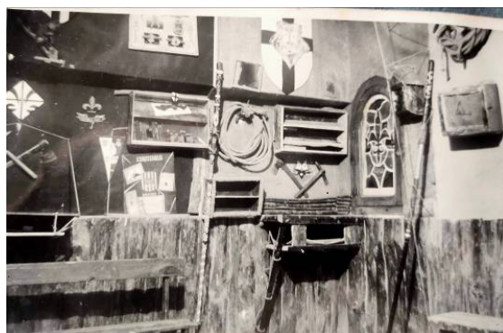
I vàrem acabar tenint cau! Un dels racons de patrulla