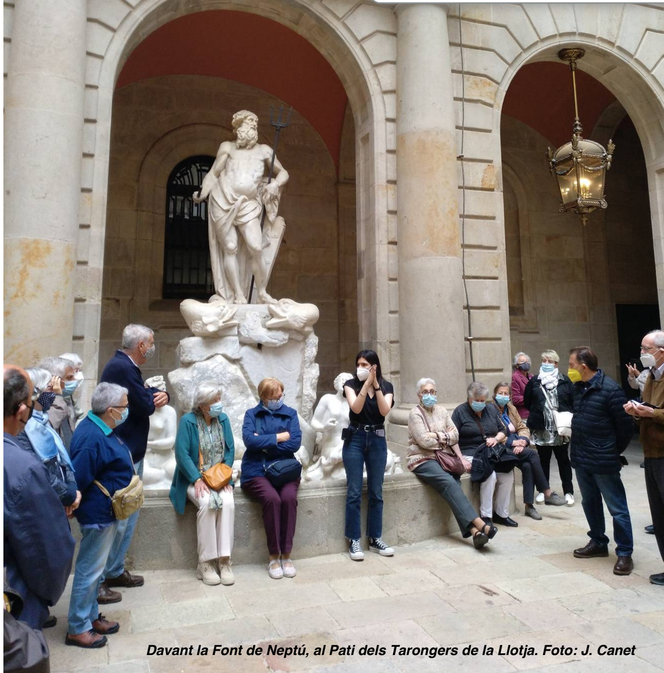
Davant la Font de Neptú, al Pati dels Tarongers de la Llotja.