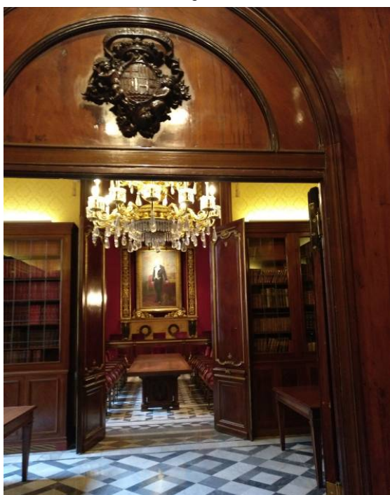
El Saló de Plens. Al fons, Antoni de Monpalau

Seguim cap al Saló de Plens, construït a sobre de l'antiga capella del pati dels tarongers eliminada en la reforma del segle XVIII, on -com el seu nom indica- s'hi celebren els Plens de la Cambra de Comerç.