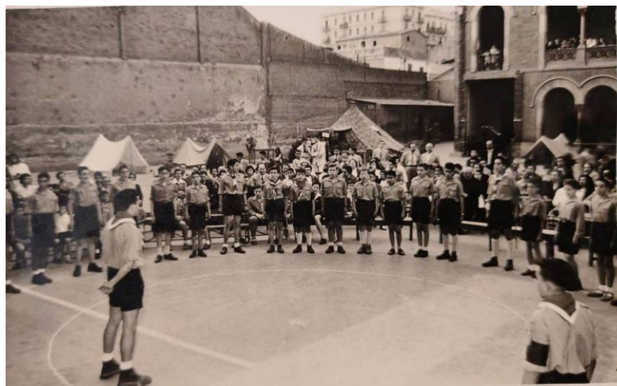
Primer acte públic al pati del Col·legi Pare Claret (1956)

Explico tot això perquè és un dels records que ens van marcar i no cal dir que l'escoltisme va ser decisiu en la integració i l'amor al nostre país, així com també en forjar amistats que encara perduren.☑