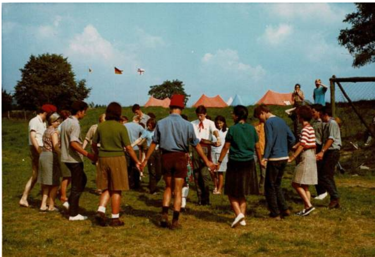
Campament a Maria Marttental

En una ruta de 25 dies que seria extremadament rica en noves experiències i nous fets de vida.