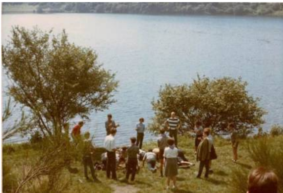
Descans vora el llac

Els que hi vam participar donem gràcies també d'haver viscut aquesta experiència entranyable d'amistat i profunditat en la fe que ens ha marcat