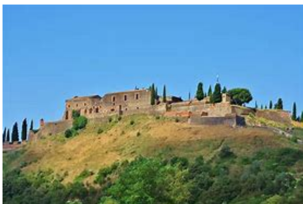
El conjunt del "Castell"

Com que no podem oferir ressenyes d'activitats realitzades en els darrers dos mesos, us farem cinc cèntims de la primera de les activitats previstes pel darrer trimestre del 2021. No cal dir que, arribat el moment, enviarem la convocatòria amb el programa i tots els detalls pràctics de costum.