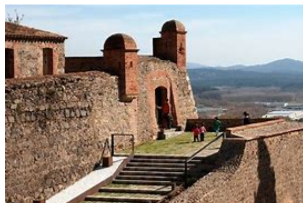
L'entrada a la fortalesa