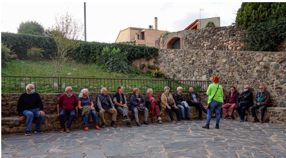
Asseguts davant l'església tancada.