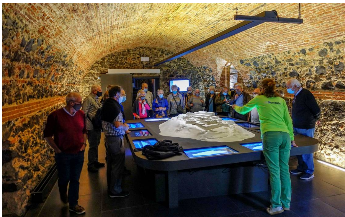
Contemplant la maqueta.

Situats al fossat, ens explica que el revellí que podem veure al davant, és una estructura de fortificació que defensava el fossat mitjançant els canons col·locats a les seves canoneres. Per accedir en aquest espai hi ha una caponera o camí espitllerat. També des del baluard major, hi havia les troneres que apuntaven al fossat. Seguint el recorregut, pugem unes escales fins el pont –abans llevadís- que dona accés al "Portal de Carros". A l'entrada ens fa una petita explicació i ens comunica que malauradament no podem veure l'audiovisual perquè no funciona, ens demana disculpes. Tot seguit entrem al cos de guàrdia on s'hi ubica el punt d'informació i el Centre d'interpretació. Ens fa una explicació a la part del davant i la segona, a la part del fons on hi ha la maqueta interactiva.