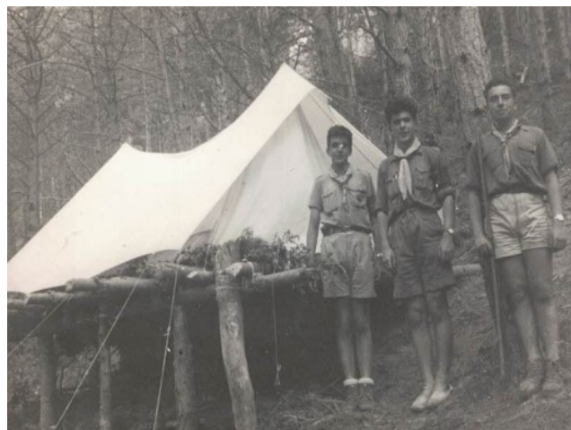
Camp d'estiu a Segudet (Andorra)(1957)