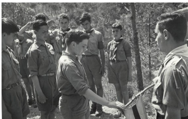
Promesa escolta. Granera, 1957