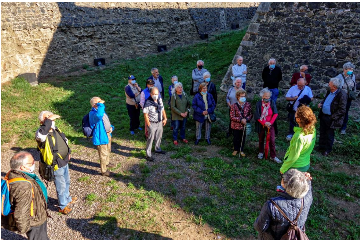
Part del grup al fossat de la Fortalesa.

Comencem la visita entrant a la cisterna, veiem l'interior i per un passadís amb una escala accedim al fossat del castell on segueix l'explicació.