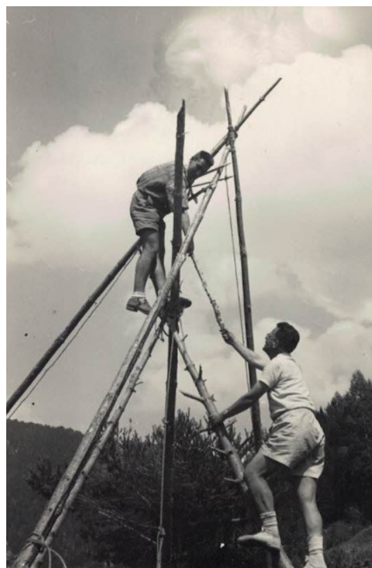
Fent l'altar. Coll d'Ordino (Andorra), 1956

De fet aquesta situació no era recomanada per BP ja que la gràcia de l'educació començava per ser els nois els que volien venir a l'escoltisme atrets per les meravelles que podien explicar els seus companys. Però l'escoltisme s'adapta a cada país segons la seva manera de fer. Per exemple els agrupaments són un necessitat a Catalunya com a defensa de la persecució i la necessitat de camuflatge i són verdaderes unitats verticals però, a França no existeixen amb aquest format.