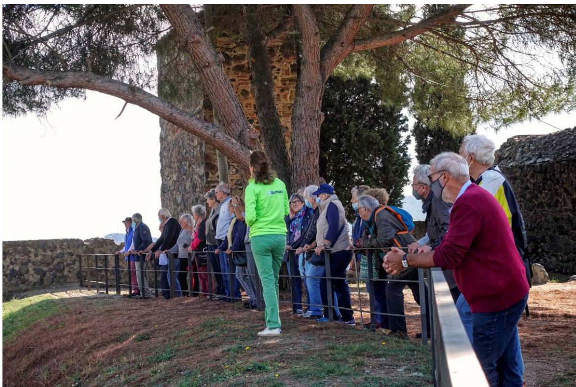
Les darreres explicacions del matí, al costat de la Torre del Rellotge.

Des de sobre el Baluard Major, tot rebent les darreres explicacions de la guia, contemplem les muralles, les torres, la vila d'Hostalric, que visitarem a la tarda i el paisatge envoltant. En acomiadem de la guia i anem baixant del castell.