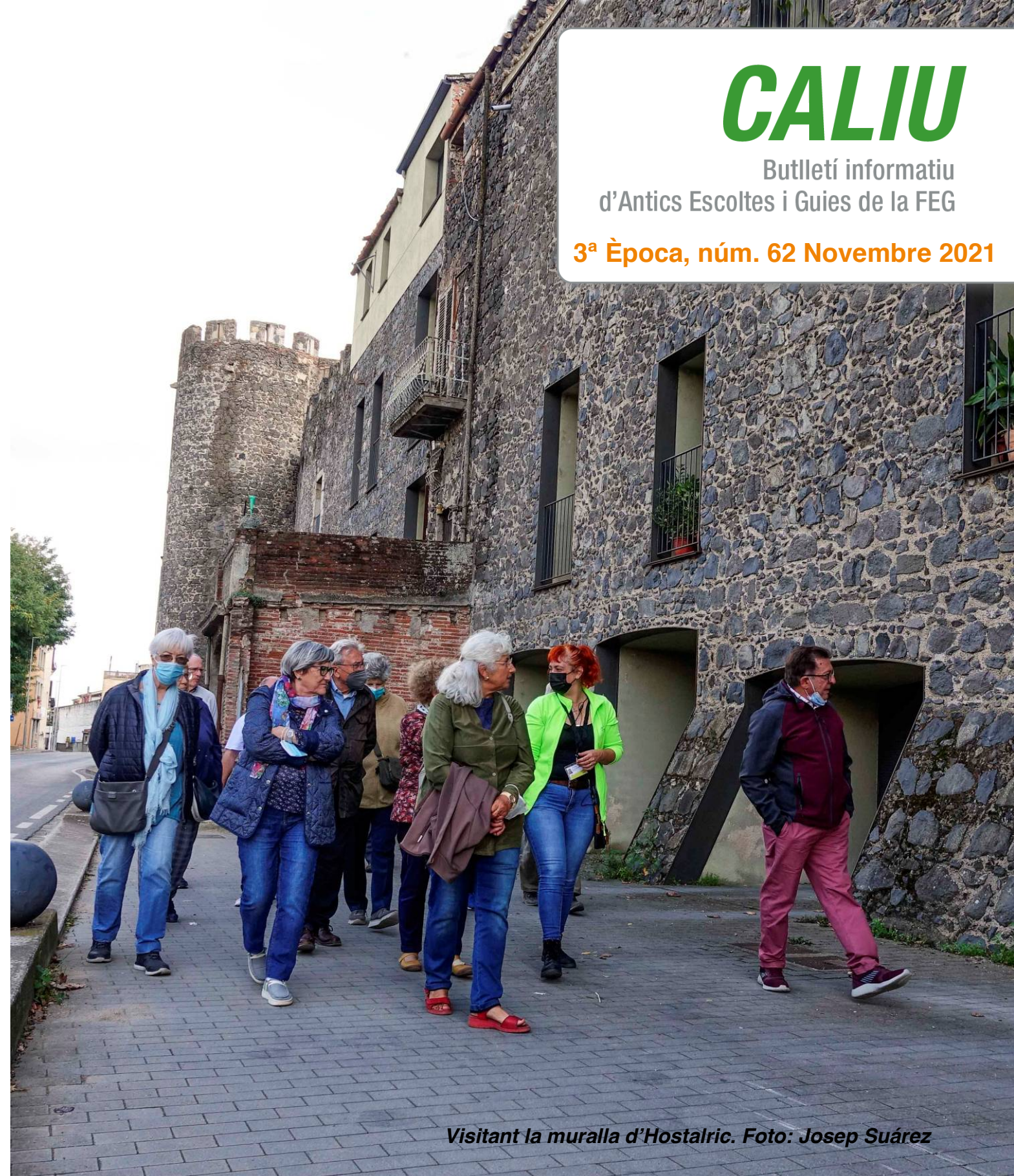
Visitant la muralla d'Hostalric.