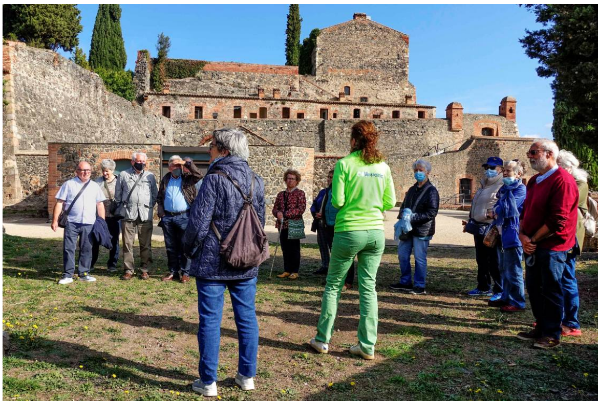
Escoltant les explicacions de la guia.

L'edifici del cos de guàrdia estava destinat a diferents usos. La nau posterior es va fer servir com a polvorí provisional i la part més propera al portal de carros, dividit en dues plantes era el cos de guàrdia i servia per allotjar la tropa.