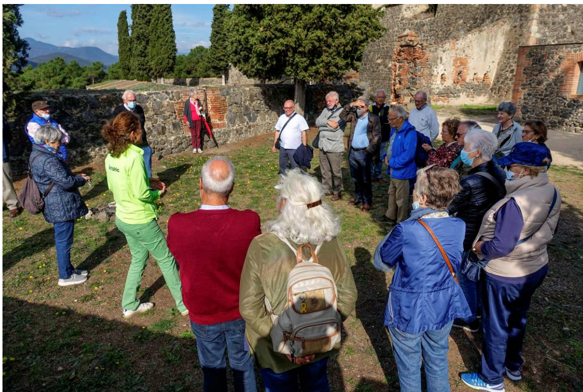
Una altra imatge del grup durant la visita.