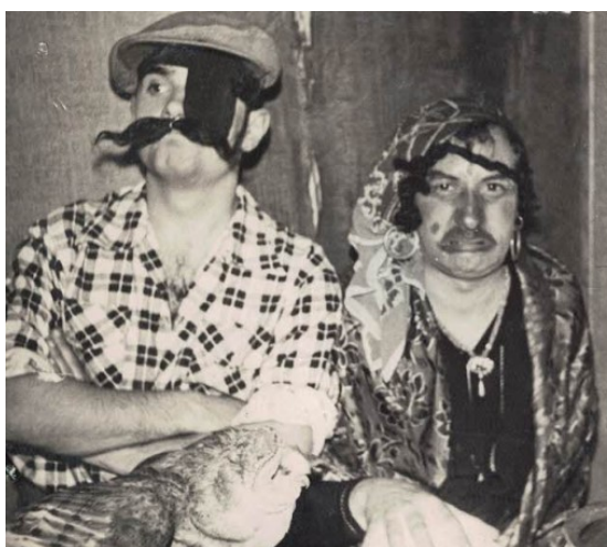
Primer Mercat de Calaf (1955). Les Pitonisses