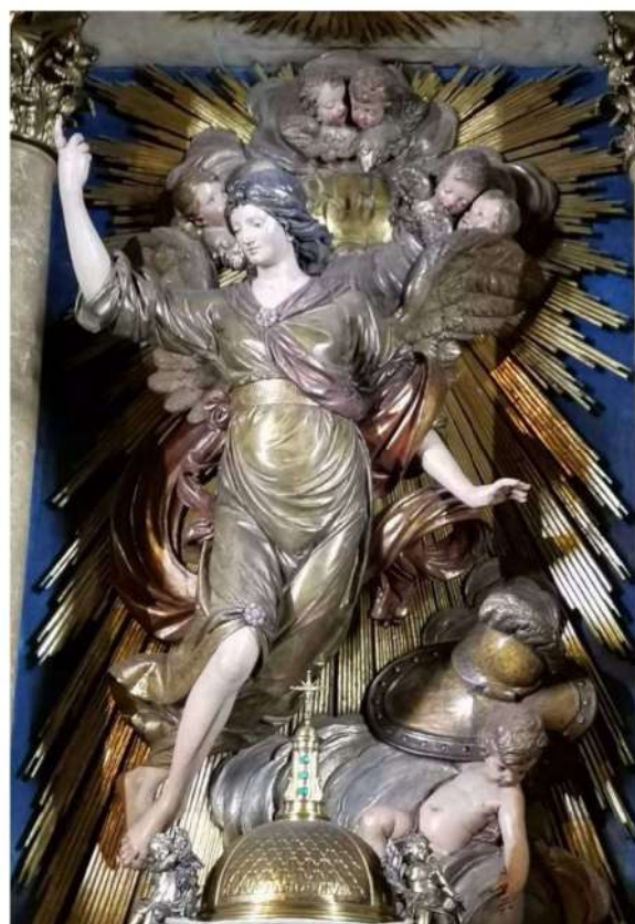
L'imatge de Sant Miquel: Foto JMB

Capella de Sant Miquel , del gremi de Tenders Revenedors, amb una escultura del sant obra de Salvador Gurri i Corominas qui treballà conjuntament amb altres membres del seu taller. La imatge de Sant Miquel es despulla aquí de la tradicional iconografia de l'àngel guerrer i masculí per apropar-se al model classicista femení de la Victòria ( Niké ). El gremi de Tenders Revenedors de Barcelona fou fundat l'any 1447 i s'establí a l'església del Pi l'any 1452, encarregant al pintor Jaume Huguet la confecció del seu primer retaule, actualment al MNAC. L'any 1663 es va substituir per un de barroc que fou l'antecessor de l'actual, en aquesta capella. Des de l'any 1798, el gremi té el privilegi pontifici de mantenir la reserva del Santíssim Sagrament. Aquest retaule no va patir danys l'any 1936.