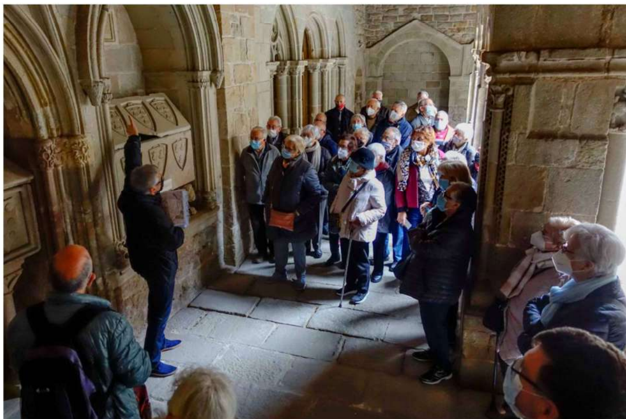
Les tombes de la família dels comtes de Bell-lloc

Acabem la visita tal com havíem començat, a la sala de l'últim l'abat Joan de Safont on hi ha una petita mostra del "sistema planetari i comentari copernicà" ideat per ell. Era fill de Besalú, monjo del monestir de Sant Cugat i catedràtic de filosofia.