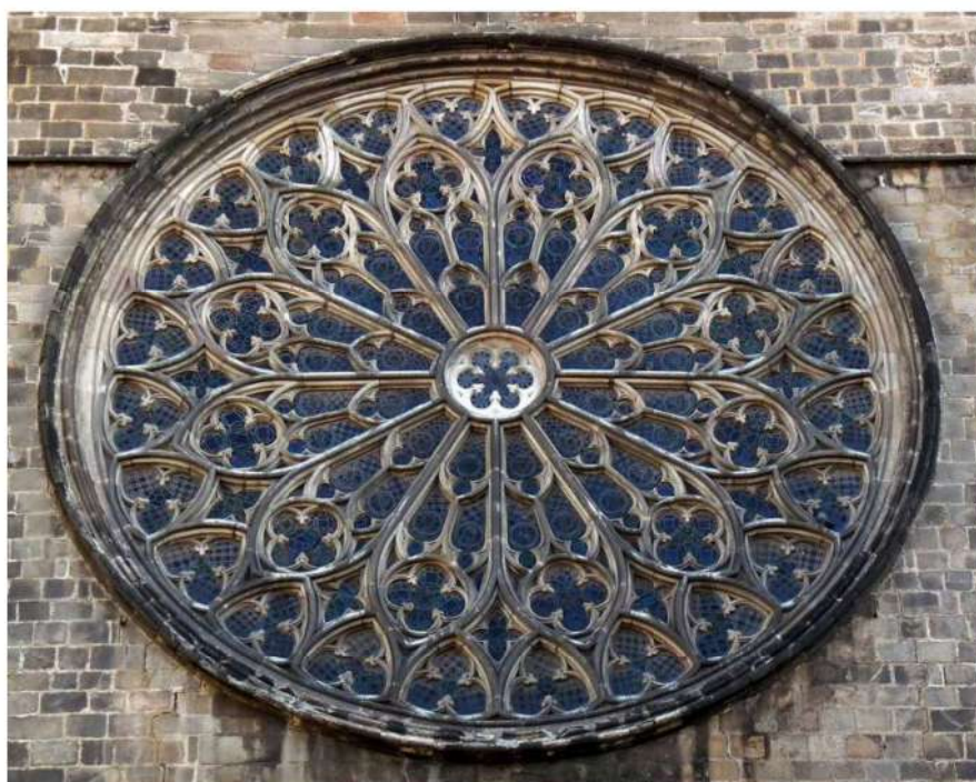
Vista exterior de la rosassa.

Ocupa un lloc destacat dins el conjunt arquitectònic, ja que es concep com una projecció a l'exterior de l'estructura interna. És un mur pla flanquejat per dues torretes octogonals, inacabades, i centrat per dues úniques obertures, la portada i la rosassa. Unes motllures estructuren horitzontalment la façana. La imatge de la Mare de Déu amb el Nen que hi havia al timpà ara presideix el presbiteri i és un excel·lent exemple d'escultura del segle XIV. La resta de la decoració de la portada és simple i es redueix, pràcticament, als elements arquitectònics. La part alta de la façana és dominada per una rosassa de grans dimensions, 10m de diàmetre, la més gran de Catalunya. El seu gran colorit, gairebé hipnòtic, el conformen diferents vitralls, que representen l'estel de David de 12 puntes, on cadascuna d'elles fa esment a una de les 12 tribus d'Israel. L'actual rosassa data de l'any 1950, és una còpia exacte de l'original trencada l'any 1936, que ja estava reconstruïda pel terratrèmol del 1428.