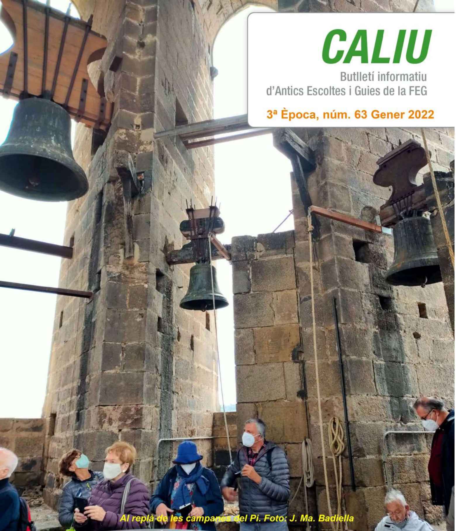
Al replà de les campanes del Pi.