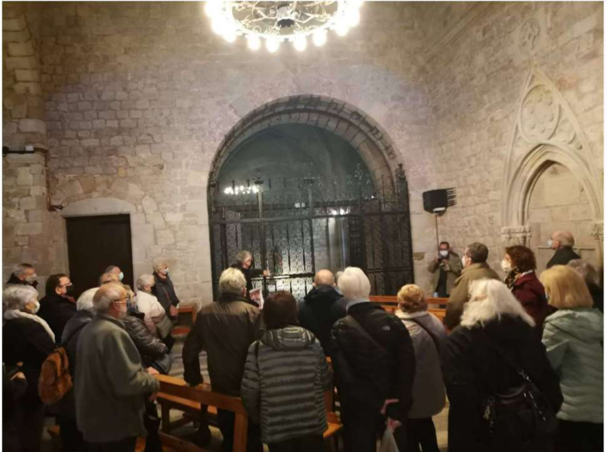
A la Sala Capitular.

Aquí el guia fa un parèntesi, mostrant uns esquemes gràfics, per explicar l'estabilitat dels arcs i murs, i el comportament mecànic de forces del sistema constructiu del romànic.