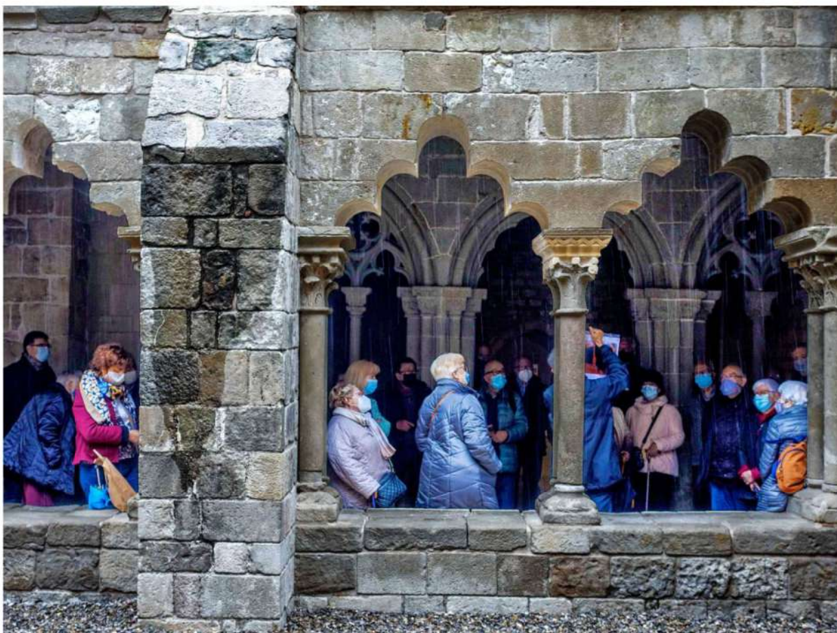
Les arcades pentalobulades del claustre

La decoració esculpida del claustre és un dels aspectes més interessants i més significatius del panorama barceloní del segle XIII. Es desenvolupa bàsicament als capitells de les columnes que sostenen les falses arcades.