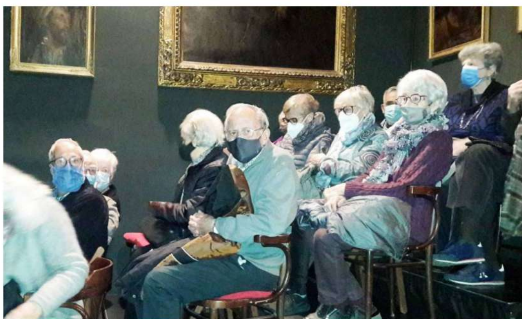
Una part dels assistents.