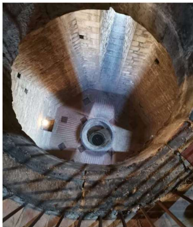
Interior del campanar.

En el cas de la torre del Pi, hem de pensar que 52 metres d'alçada eren una barbaritat al segle XIV, i que ho va continuar sent fins al segle XIX ja que era el punt més alt de la ciutat. La construcció del campanar és realment un cas insòlit ja que en l'actualitat ha pogut conservar l'estructura original. Segons diu la llegenda, la torre amb parets de 3,5 m de gruix s'ensorrava quan arribava a una certa alçada. El mestre director d'obres es desesperava cada vegada més profundament i estava a punt d'abandonar, quan va rebre una visita misteriosa que, per la pudor de sofre que feia, va deduir que podria ser el diable. Aquest li va fer una proposta que no va poder refusar: ell ajudaria als paletes a construir la torre si a l'arribar al graó número 100 li donava la seva ànima.