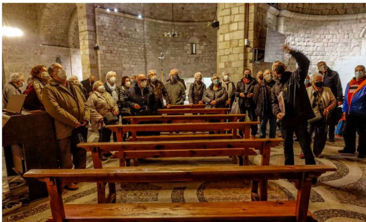
Interior de l'església

Seguidament entrem a l'església i un cop a cobert el guia ens explica la història del monestir.