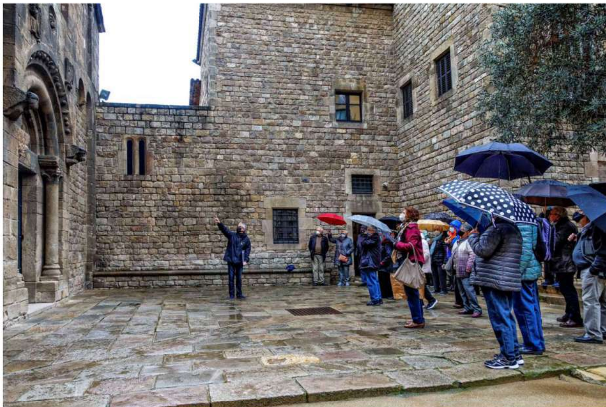
Sota els paraigües ens va descriure la composició de la façana.