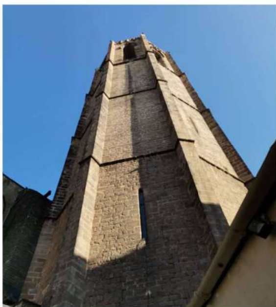
El campanar.

El presbiteri està presidit per la imatge de la Mare de Déu del Pi, realitzada amb pedra del Vallés, tova i molt emmotllable, talla gòtica, originàriament policromada del segle XIV. Va sobreviure al bombardeig de 1714. L'altar d'alabastre és del segle XX i el sant Crist del segle XV.