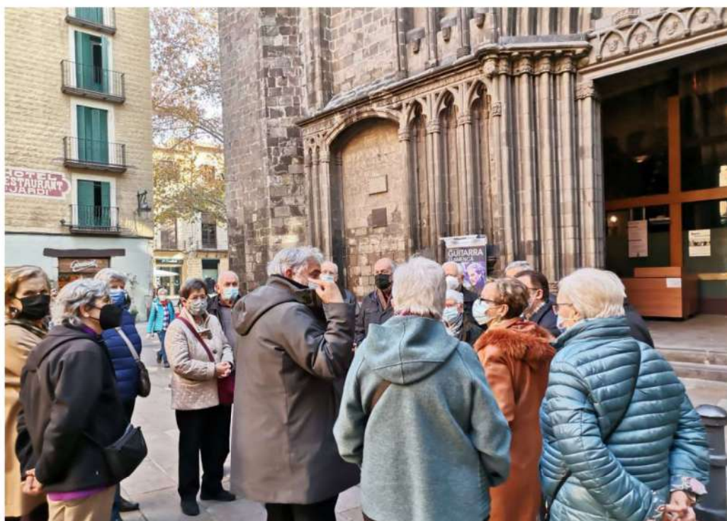
El grup del matí, a punt de començar la visita.

La visita la comencem amb l'arxiver Jordi Sacasas per la façana principal, de començaments del segle XIV.