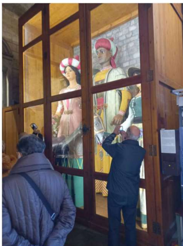
Els gegants del Pi.