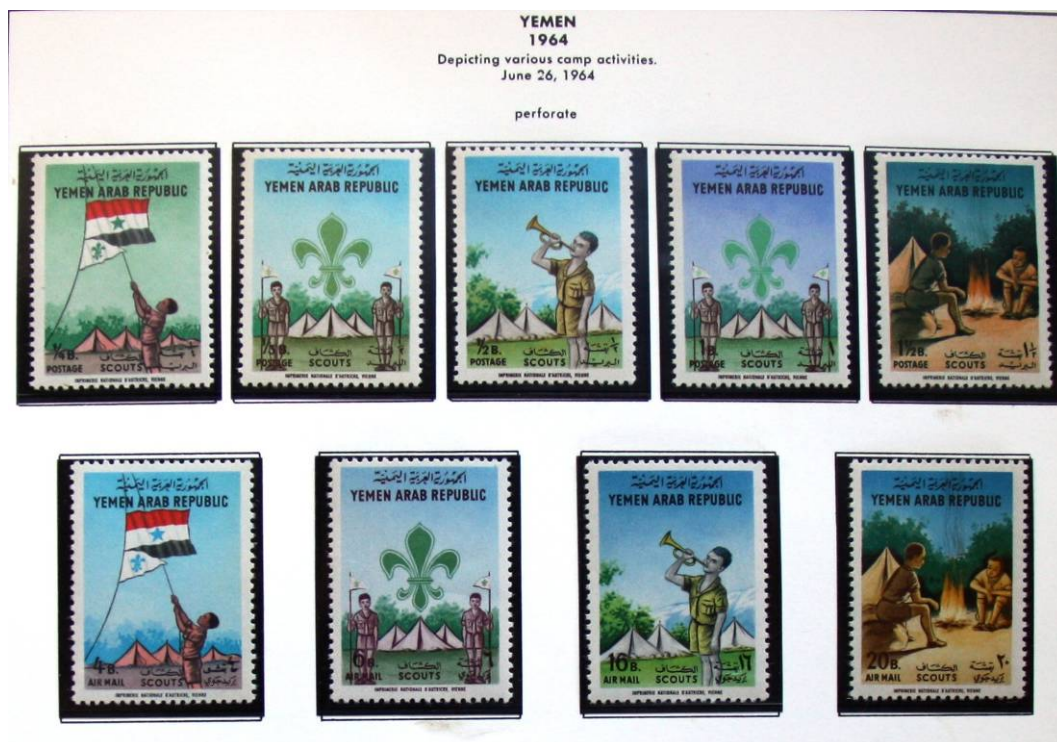
Yemen. Un país amb guerra civil del 2015 ençà. Col·lecció Manel Subirà dipositada a Can Cadena i consultable.

L'explicació ha estat extensa però l'interès del guia ens ha fet conèixer moltes curiositats. Ara sabem que al darrere de cada figura sempre hi ha uja bonica història. Amb això tanquem una part del relat de la sortida cultural del desembre passat