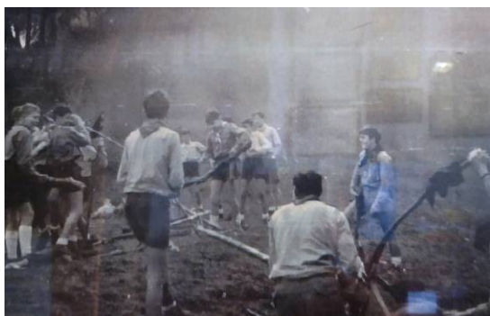
Construcció de catapultes a St. Martí de Montnegre (1964)

L'estiu 1964 – Vam trobar un jove de Pineda que ens va voler conèixer per ser el futur Cap de Secció, formava part de l'escoltisme de Calella i deixar el seu grup per un grupet que tot just començava li feia recança.