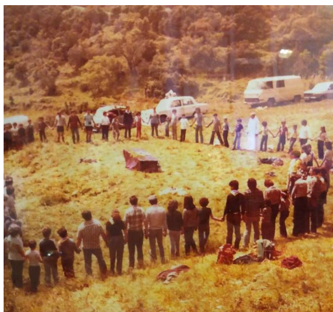
Trobada de pares

Nota: El 1962 es va formar un grup de noies guies que van durar uns anys i no formaven part de l'agrupament. Més endavant algunes d'elles van ser caps de llops i daines