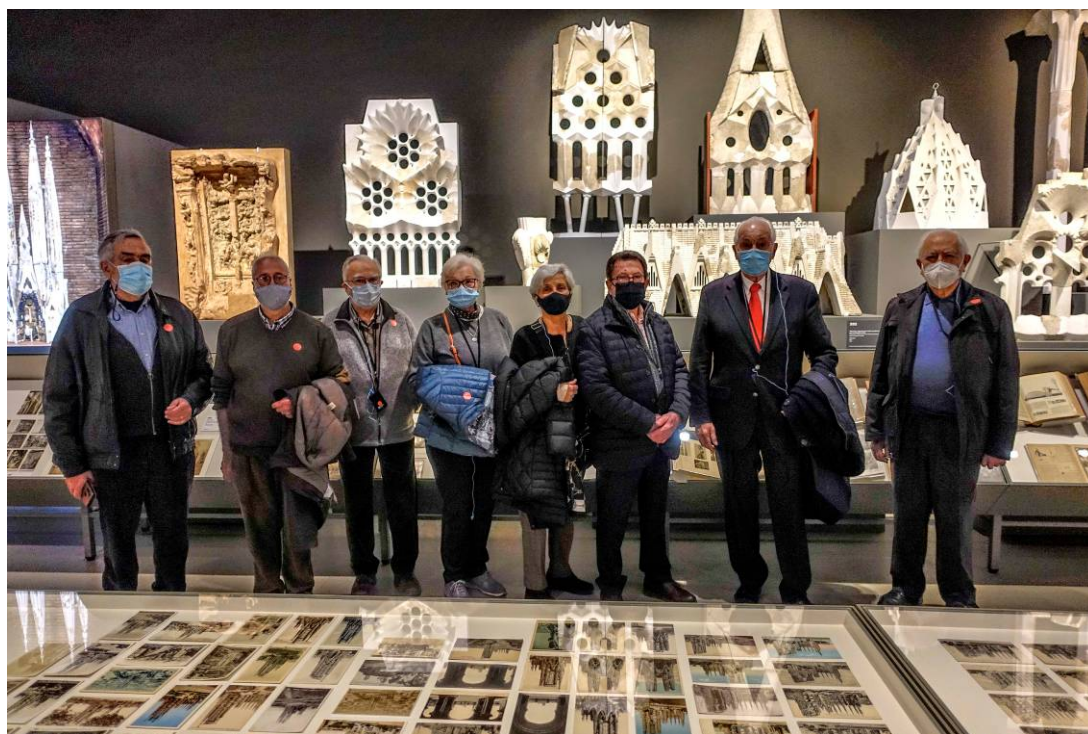
El primer grup, en l'àmbit dedicat a la Sagrada Família

No cauré ara en la temptació d'explicar el contingut de l'exposició que és un recull de documents i plànols de moltes de les obres de la seva vida, de maquetes i mostres dels mobles i objectes que ell va dissenyar. La veritat és que costa d'entendre com, amb els mitjans de treball que va disposar, va tenir temps de fer tantes coses. Només de pensar que no tenia ordinadors, ni la maquinària actual,... No és d'estranyar que a mida que passa el temps la seva figura s'engrandeixi ☑