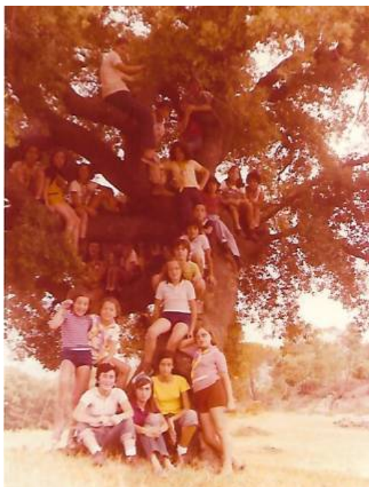
Campament de Daines (1974)

Curs 1974-1975 – Ens plantegem l'opció coeducativa al obrir la unitat de daines. i conjuntament treballem amb Llops-Daines. (Quim Franch).