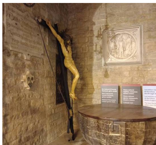
El "Sant Cristo" Gros, ara al baptisteri