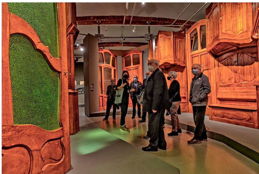
Una mostra del mobiliari de la Casa Milà

I com tantes vegades passa, som els catalans i en especial els barcelonins els que necessitem aprendre a valorar el que tenim més a prop. Per això vàrem creure oportú organitzar la visita a l'exposició que te lloc al MNAC sobre la vida i obra del genial arquitecte.