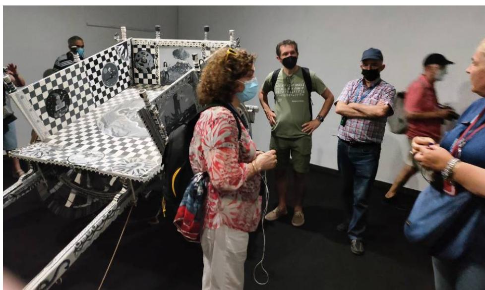
Salemi. Museu de la Màfia.

L'últim dia a l'illa també és atapeït i comença amb el clímax artístic del viatge: la visita a la catedral de Santa Maria de Monreale, feta aixecar als afores de Palerm per Guillem II de Sicília l'any 1172 amb uns mosaics de temàtica bíblica i hagiogràfica extraordinaris. Acabats el 1182, són obra de grans artistes grecs i bizantins, el dibuix dels quals es pot reconèixer en la pintura mural de la sala capitular de Sixena.