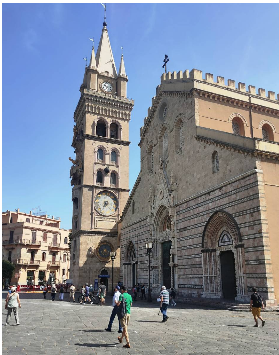
Messina. La Catedral i la torre del rellotge.

Toca reposar bé a l'hotel de Palerm on ens allotgem, a quatre passos literalment del centre neuràlgic d'una ciutat força caòtica que s'estima o s'odia, segons que ens confessa la guia local. Perquè l'endemà toca llevar-nos d'hora per visitar una altra de les meravelles artístiques del viatge: la Capella Palatina del palau dels Normands, la seu actual del parlament sicilià.