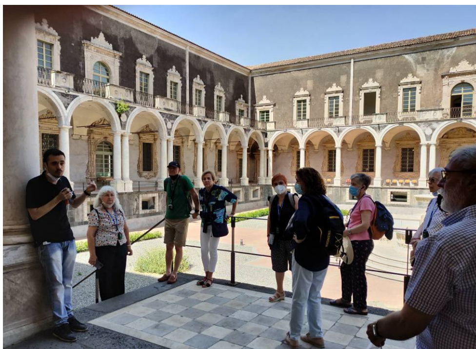
San Nicolò l'Arena. Un dels claustres.

El tercer dia deixem aparcat l'autocaret perquè ens toca descobrir alguns racons ben interessants de Catània, molts dels quals relacionats amb el període català de l'illa. Comencem amb el monestir benedictí de San Nicolò l'Arena, que a més d'uns claustres i passadissos interminables, ens mostra la dimensió d'algunes erupcions històriques de l'Etna, amb la lava arribant fins a les portes de la ciutat.