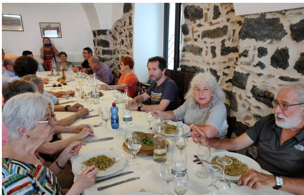
Bronte. El dinar dels festucs.

El dinar el fem a Bronte, la capital del conreu de pistatxos a l'illa, i ens ho demostra el menú que ens han preparat: torrada amb pistatxo, pasta amb crema de pistatxo, carn amb salsa de pistatxo i gelat de pistatxo.