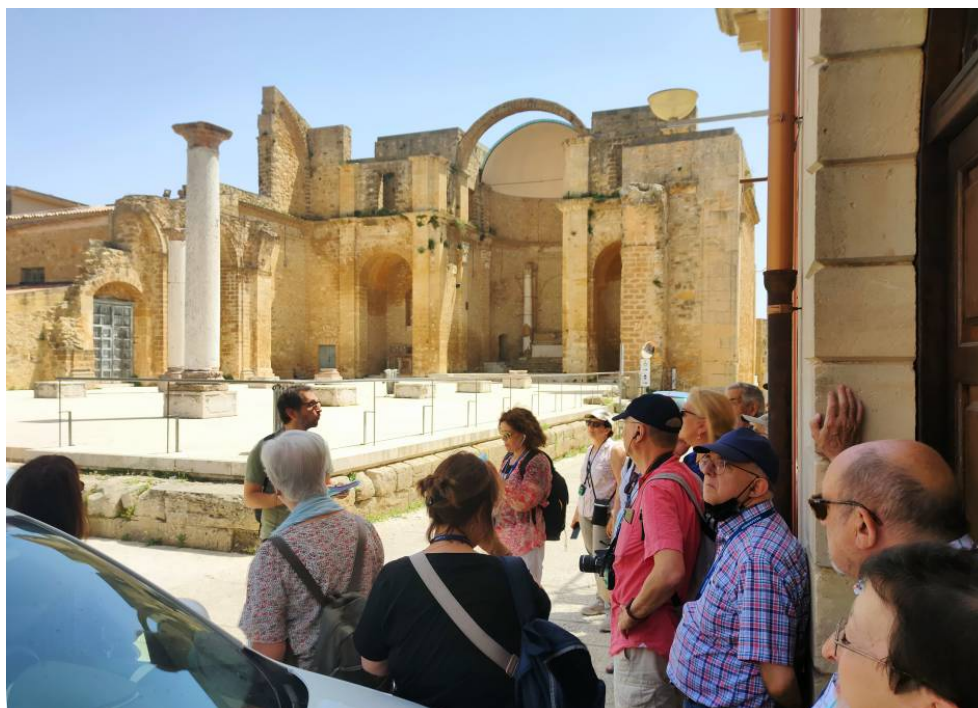
Salemi. Església enderrocada pel terratrèmol.