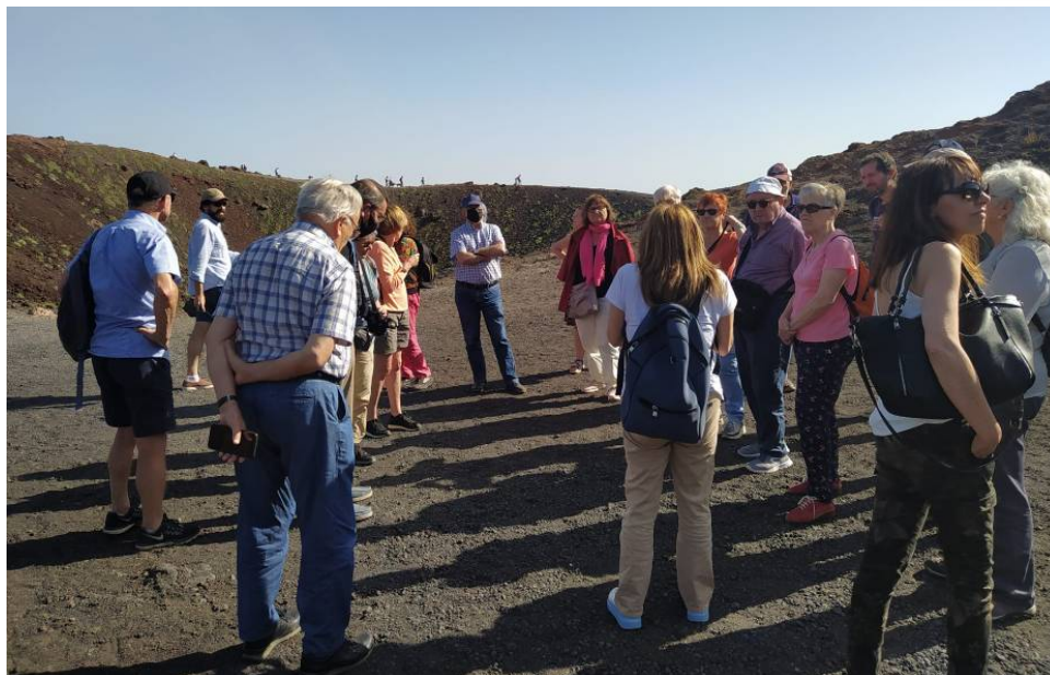
A la falda de l'Etna, escoltant les explicacions de la guia.

El tercer dia deixem aparcat l'autocaret perquè ens toca descobrir alguns racons ben interessants de Catània, molts dels quals relacionats amb el període català de l'illa. Comencem amb el monestir benedictí de San Nicolò l'Arena, que a més d'uns claustres i passadissos interminables, ens mostra la dimensió d'algunes erupcions històriques de l'Etna, amb la lava arribant fins a les portes de la ciutat.