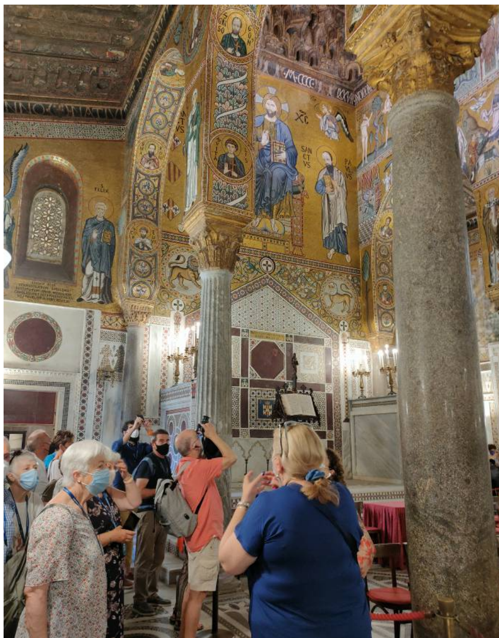
Palerm. La Capella Palatina del Palau dels Normands

D'estil bizantí, és enriquida amb mosaics preciosos que donen com a resultat una de les joies medievals més ben conservades del món. I, ací i allà, podem comprovar que els únics escuts presents a les parets són el de Catalunya i el del Regne de Sicília, format pels quatre pals de Pere el Gran i l'àguila de Suàbia de la seva muller Constança.