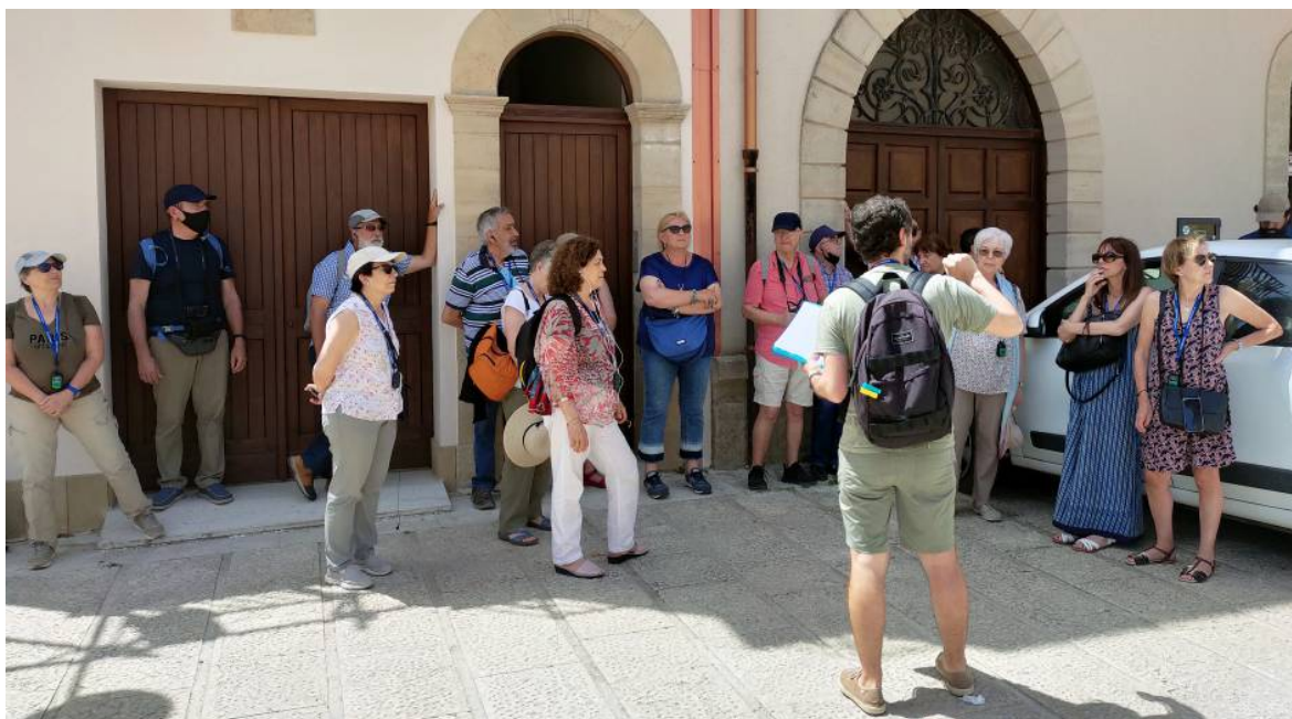
Un carrer de Salemi