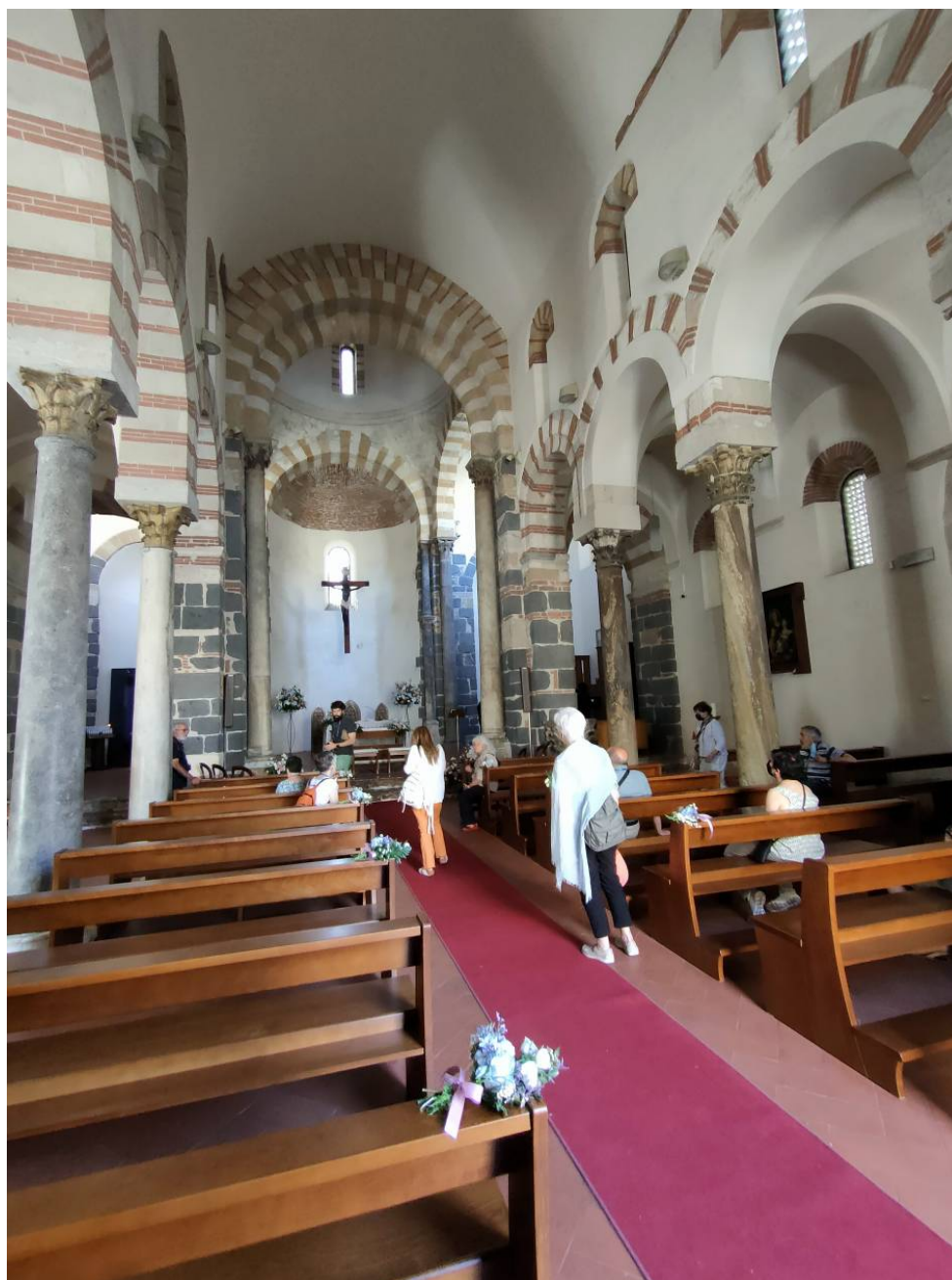
Interior de l'església de la Santíssima Annunziata dei Catalani

Després de visitar la catedral, amb l'espectacular torre del rellotge al costat, pugem a l'autocar per anar cap a la preciosa localitat costanera de Cefalù, on ens esperen els mosaics bizantins del Duomo, presidits per un Pantocràtor del Crist evangelitzador que no podem veure de prop per l'enèsim casament sicilià d'aquests dies. Abans d'arribar a Palerm, ens desviem una mica de la ruta i visitem el castell de Caccamo, un dels més grans i ben conservats de l'illa, que va ser propietat de la gran família dels Chiaromonte i, posteriorment, de llinatges catalans com els Prades, els Montcada, els Cabrera i, finalment, els De Spuches ja esmentats, que el van vendre a la Regió de Sicília el 1963.