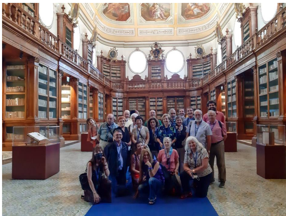
El grup a la biblioteca del monestir.