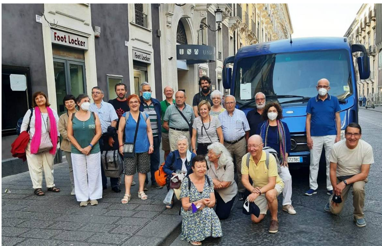
El grup, al complet.