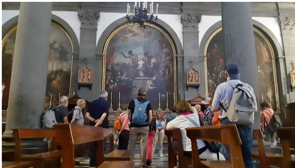
Randazzo. Visitant l'església.

El dinar el fem a Bronte, la capital del conreu de pistatxos a l'illa, i ens ho demostra el menú que ens han preparat: torrada amb pistatxo, pasta amb crema de pistatxo, carn amb salsa de pistatxo i gelat de pistatxo.