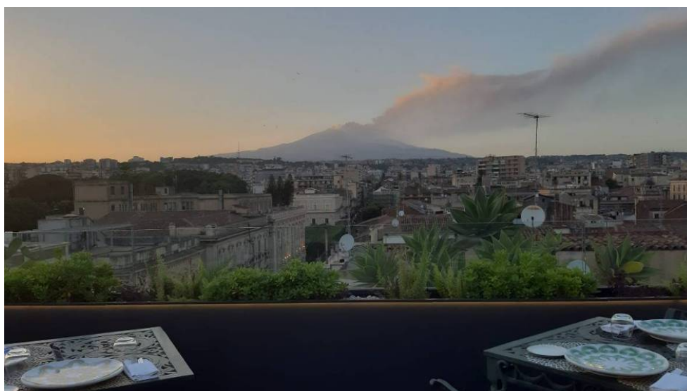
El volcà Etna des de la terrassa del restaurant de l'hotel.

Ja a Catània, ens allotgem en un hotel situat a la principal artèria de la ciutat, la via Etna. I, com ens insinua el nom, les vistes des de la terrassa del restaurant són immillorables amb l'Etna fumejant de fons.