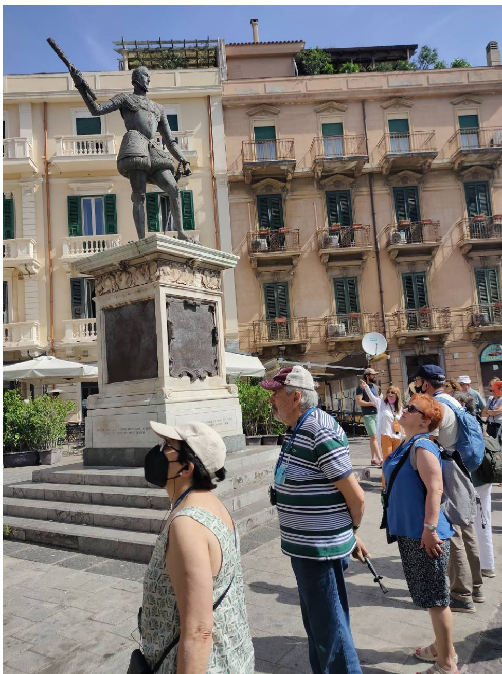
La Plaça "dei Catalani". El monument, però, és dedicat a Juan de Àustria

Construïda en època normanda amb uns característics tocs bizantins, àrabs, romànics i gòtics, sembla que cap al final del segle XV va esdevenir la seu de la confraria de comerciants i mercaders catalans, de la qual va prendre el nom actual. Tant l'exterior com l'interior són plens d'escuts de Barcelona i de Catalunya, i en una inscripció en una paret es deixa ben clar que "ANNVNCIACIONIS TEMPLVM CATHALANORVM EST".